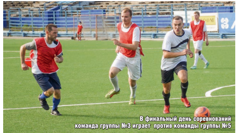
В финальный день соревнований команда группы №3 играет против команды группы №5

– Когда сборная замотивирована выиграть и все спортсмены выкладываются на поле, совершенно неважно, насколько удач-