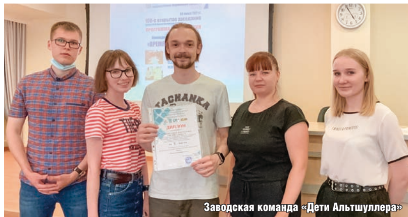
Заводская команда «Дети Альтшуллера»

Второе место заняла заводская команда в командно-технической игре для молодых специалистов предприятий и организаций г. Кирова «Время изобретать» в библиотеке им. А.И. Герцена. Название для сборной выбрали в честь автора теории решения изобретательских задач – «Дети Альтшуллера».