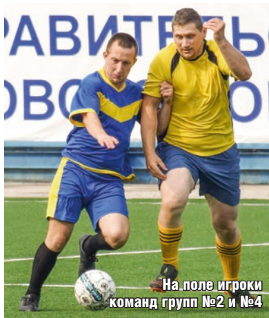
На поле игроки команд групп №2 и №4

– На протяжении всего турнира мы старались играть, не теряя кон-